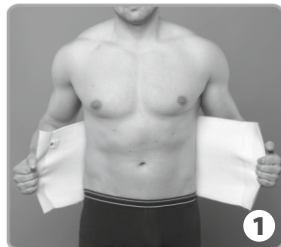
СХЕМА НА ПОСТАВЯНЕ

При измерване на обиколката на талията сантиметровата лента трябва да прилепва по тялото, без прекалено да я отпускате или пристягате.