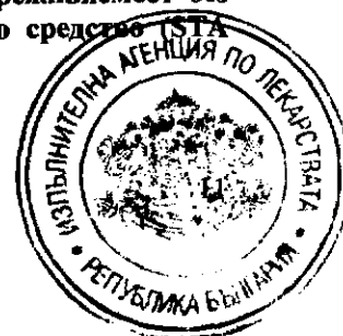
Таблица 6 Анализ на секвентната терапия по отношение на преживяемост без заболяване при прилагане на летрозол като първо ендокринно средство (STA популация със смяна на терапията)

Анализът на секвентната терапия (STA) се отнася до втория основен въпрос на BIG 1-98, а именно дали секвенираното прилагане на тамоксифен и летрозол превъзхожда монотерапията. Няма сигнификантни разлики по отношение на DFS, OS, SDFS и DDFS при смяна на терапията спрямо монотерапията (Таблица 6).