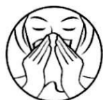
1. Изчистете носа