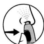
4. Натиснете бутона