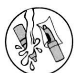
5. Почистете и подсушете