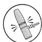
6. Поставете обратно капачката

Ако спрейт не бъде изхвърлен по време на пълния ход на активиране или ако продуктът не е бил използван повече от 7 дни, помпата ще трябва да се зареди отново с 2 напompвания.