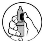
2. Палец върху бутона