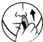
3. Вкарайте в носа